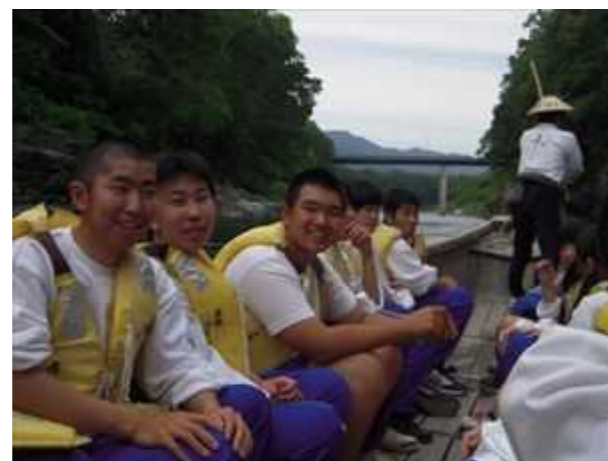
水面の涼しい風が 気持ちいいです。