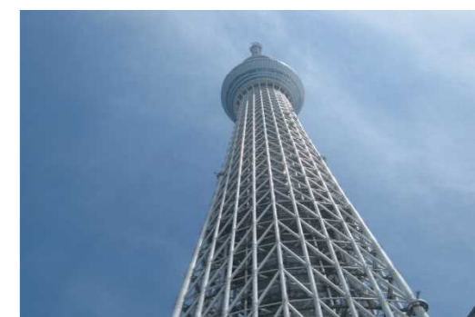
学校からも見えるスカイツリー。 近くで見たら高くてビックリ。