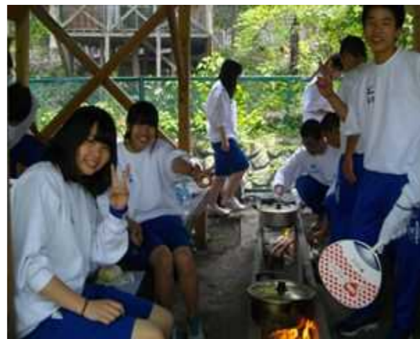
ほっとしてピース（左女子）

カレーライス作りでは各クラスで慣れない手つきで、焦げないようにご飯を炊いたり、カレースープにならないように水の量に注意して作り上げました。なかなかのできばえでみんな笑顔で食べていました。自分たちで作ったご飯とカレーを食べながら達成感を共に味わい、クラスの結びつきが強まったのではないかと思います。昼食後、長瀬ライン下り体験と埼玉県立自然博物館の見学をしました。自然に囲まれながらのライン下り。天気もちょうどよく、空気がおいしく最高でした。より一層、クラスの親睦が深まったのではないかと思います。